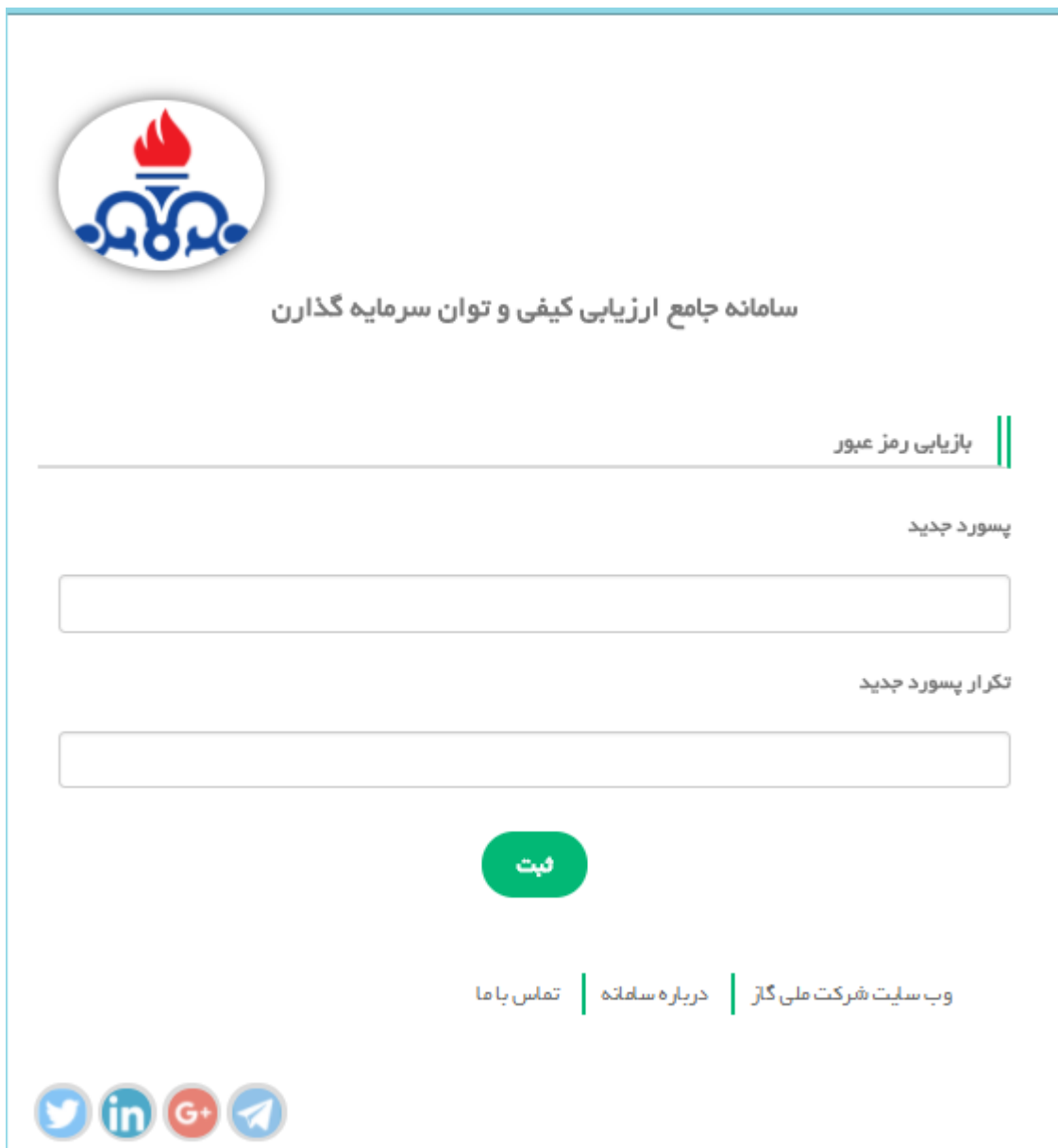
شکل شماره ۲

پس از کلیک بر روی لینک تغییر رمز عبور (شکل شماره ۲) را مشاهده خواهید کرد. رمز عبور جدید و تکرار رمز عبور جدید را وارد نمایید و دکمه ثبت را انتخاب کنید.