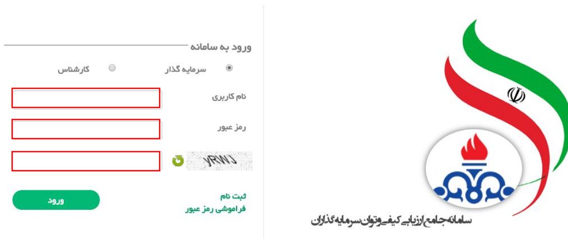
شکل شماره ۴

برای ورود به سامانه ، همانند (شکل شماره ۴) گزینه ی سرمایه گذار را انتخاب کنید و نام کاربری و رمز عبور و تصویر امنیتی خود را وارد کنید و دکمه ورود را انتخاب کنید در صورتی که هر یک از اطلاعات را اشتباه وارد کنید با پیغام خطا مواجه خواهید شد.