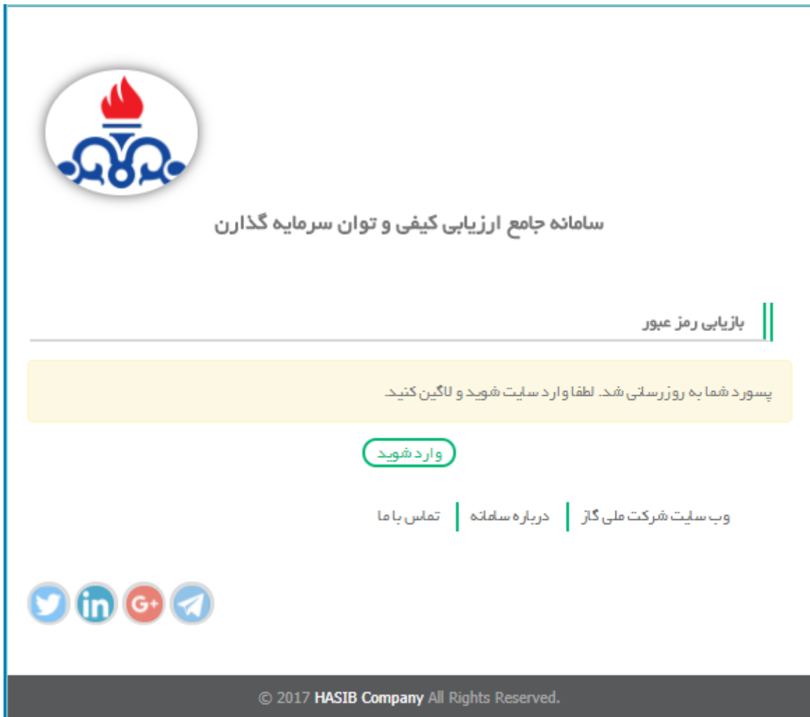
شکل شماره ۳

در صورت موفقیت آمیز بودن مراحل، پیغام همانند (شکل شماره ۳) را مشاهده خواهید کرد.